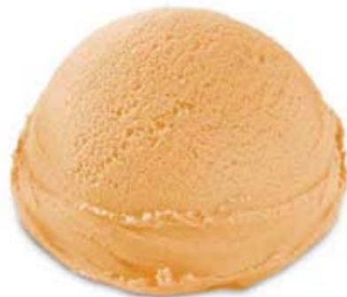
turrón de jijona Ref. 01901