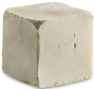
leche merengada Ref. 01800