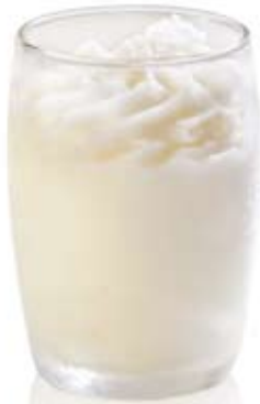
sorbete de limón. Ref. 01702