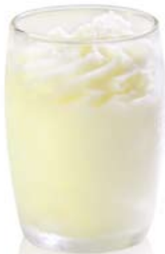
sorbete de limón al cava. Ref. 01705