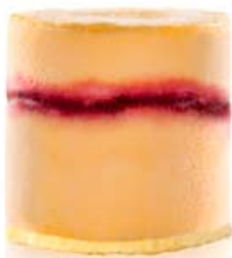
maracuyá con fresa Ref. 01101