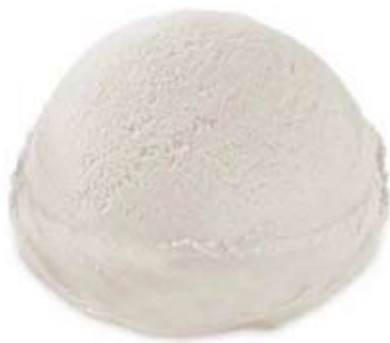
leche merengada Ref. 01900