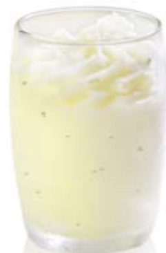
sorbete de mojito. Ref. 01701