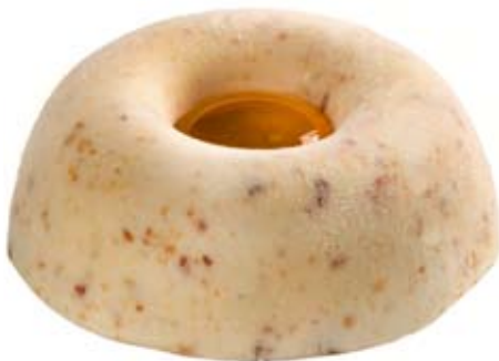
gorgonzola dulce con nueces. Ref. 01302