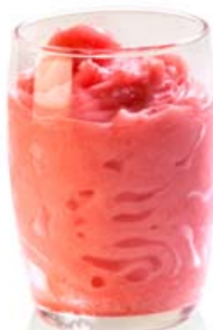
sorbete de fresa al cava. Ref. 01700