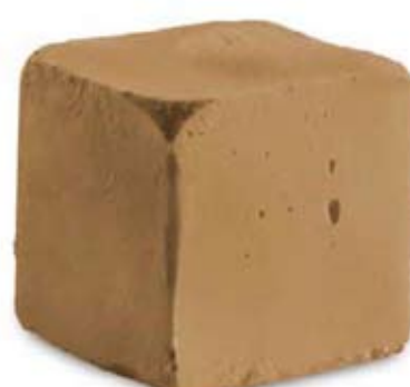
chocolate Ref. 01803