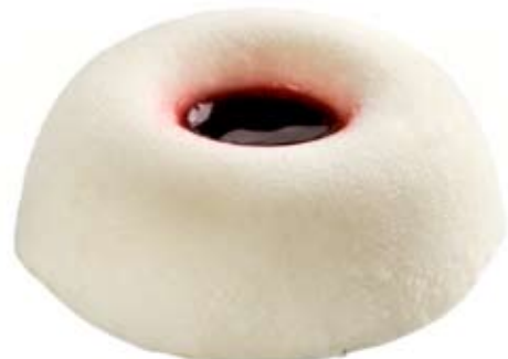
2 quesos con membrillo. Ref. 01301