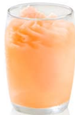
sorbete de mandarina. Ref. 01707