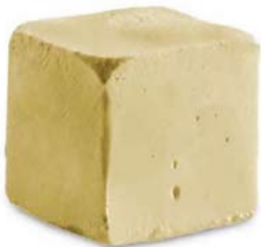
vainilla bourbon Ref. 01802