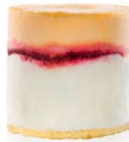
melocotón de calanda, yogur natural con frutas del bosque Ref. 01102