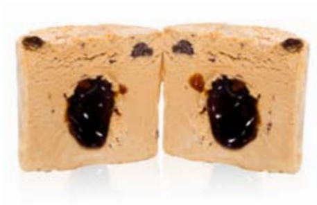
cappuccino, trufas y caramelo Ref. 01105