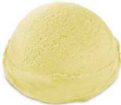
vainilla bourbon Ref. 01903