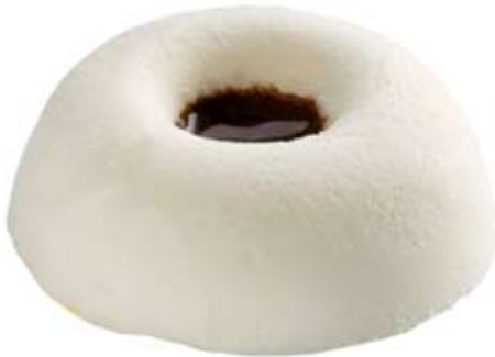
queso de cabra con caramelo. Ref. 01300