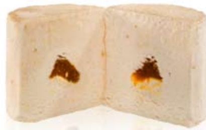
plátano de canarias con dulce de leche Ref. 01106