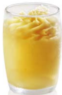
sorbete turrón a la piedra Ref. 01712