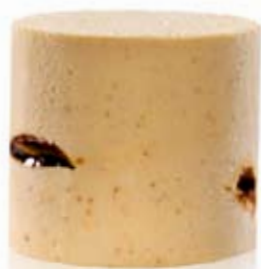
turrón de jijona con caramelo Ref. 01100