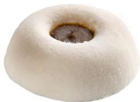
camembert con mermelada de higos. Ref. 01303