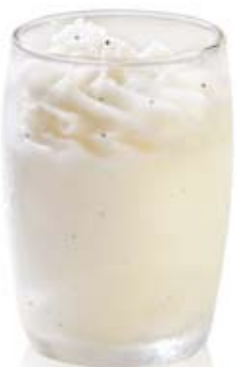
sorbete de gin tonic. Ref. 01711