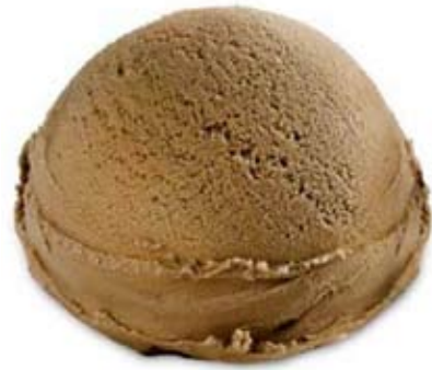
chocolate Ref. 01902