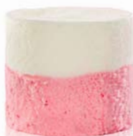
yogur natural de cereza Ref. 01103