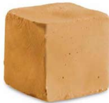
turrón de jijona Ref. 01801