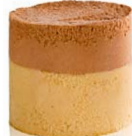
turrón de jijona con chocolate Ref. 01104