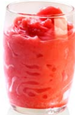
sorbete de fresa. Ref. 01704